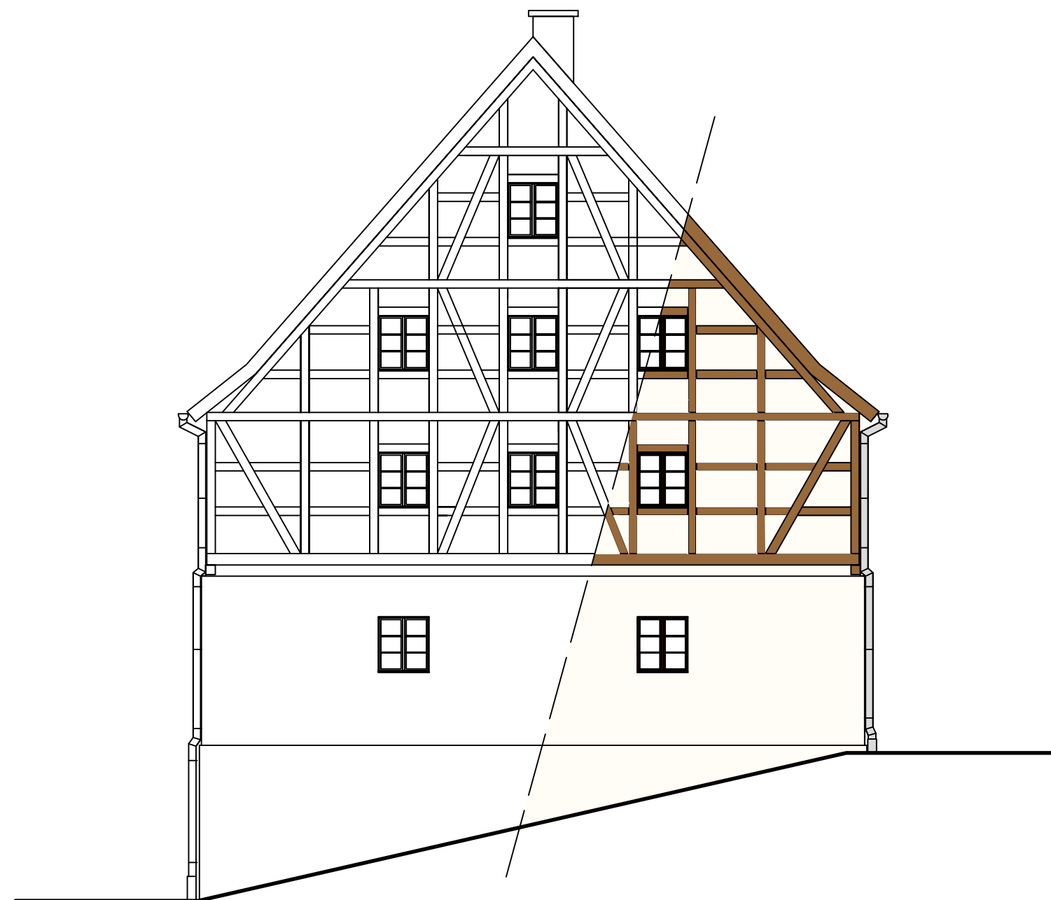
ELEWACJA PÓŁNOCNA 1:100